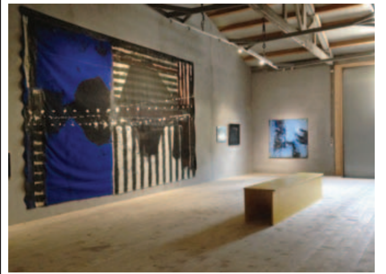
L'exposition d'Olivier Saudan est à voir à la galerie Contre Contre jusqu'au 11 juin.

Saint-Maurice compte un nouveau lieu d'expositions permanentes. Celui-ci a été verni jeudi dernier et restera ouvert, cette année, jusqu'à fin octobre-début novembre. Située au bout de la rue de la Tannerie (suivre l'indicatif parking P2), la galerie Contre Contre propose un espace convivial d'environ 200 m 2 . Premier à y dévoiler une partie de ses œuvres, Olivier Saudan, vainqueur du prix Sandoz en 2007. Le peintre octodurien propose de faire découvrir son travail lié à un séjour en Ecosse. A la fois de l'abstrait et du figuratif.